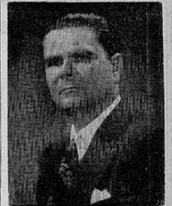
LIC. DON FERNANDO VOLIO SANCHO Ministro de Gobernación

Sintetizando la conversación ofrecemos seguidamente sus valiosas e importantes declaraciones: "En primer lugar, —nos dijo— de —Pasa a la Pág. CUATRO